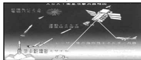
نگاره ۳: سلاح‌های ضدماهواره

روسها تحقیقات بر روی سلاح‌های انرژی مستقیم را از سال ۱۹۷۶ بار دیگر تحت پروژه‌ی Fon از سرگرفت، اما فناوری لازم برای ساخت و تجهیز لیزرهای گازی دینامیکی پر قدرت و سیستم‌های پرتوی ذرات باردار خنثی تا مدت‌ها دور از دسترس دانشمندان روسی بود. در اوایل دهه‌ی ۸۰ روسیه در رقابت با سامانه‌های هوا پرتاب ASAT آمریکا، با استفاده از یک میگ Mig-۳۱ به عنوان سکوی پرتاب، شروع به گسترش موازی برنامه‌های هوا پرتاب کرد. در ۱۹۸۲ ایالات متحده یکی از سامانه‌های هواپرتاب خودش را که تجهیزات هوا پرتاب مینیاتوری (ALMV) نامیده می‌شدند، آزمایش کرد. این سامانه‌ها از یک جت F-۱۵ حامل یک موشک ضدماهواره (۱۵) (ASM) که مستقیماً زیرخط مرکزی هواپیما قرار می‌گرفت- تشکیل می‌شد. جت F-۱۵ مورد نظر که برای این هدف خاص طراحی شده بود می‌توانست موشک را به باتری ذخیره، میکرو پردازشگر جت و ارتباط اطلاعاتی با سیستم هدایت میان مرحله‌ی مجهز کند. نخستین پرتاب یک موشک ضدماهواره در ژانویه ۱۹۸۴ انجام شد. این موشک قرار بود از یک نقطه مجازی در فضا عبور کند. در پرتابی دیگر در همان سال سه موشک ضد ماهواره‌ی آمریکایی با هدف اصابت به سه منبع مادون قرمز در اتمسفر شلیک شدند. به دنبال این آزمایش‌های موشکی، ایالات متحده سرانجام در سال ۱۹۸۵ یکی از ماهواره‌های آمریکایی را با موشک منهدم کرد.