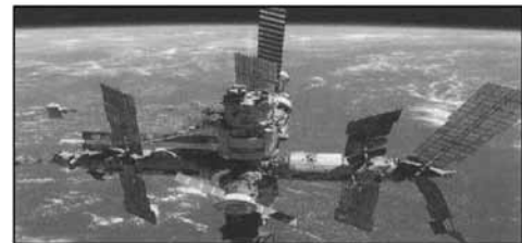
نگاره ۲: ایستگاه فضایی میر

زمین قرار داد. براساس برنامه‌ریزی سازمان فضایی شوروی (سابق)، این روند با ساخت ایستگاه فضایی عظیم نسل چهارم با نام میر-۲ در سال ۱۹۹۳ وارد مرحله‌ی جدیدی شد، اما با فروپاشی شوروی و بحران مالی دهه‌ی ۱۹۹۰ در روسیه، ابعاد برنامه‌ی ایستگاه میر-۲ به دلیل کسر بودجه کاهش یافت و با لغو پروازهای شاتل بوران، پروژه ایستگاه فضایی میر-۲ با تأخیرات پی در پی مواجه گشت. در سال ۱۹۹۲ سازمان‌های فضایی روسیه و اروپا مذاکراتی برای همکاری مشترک در ساخت و گسترش ایستگاه فضایی میر-۲ آغاز کردند.