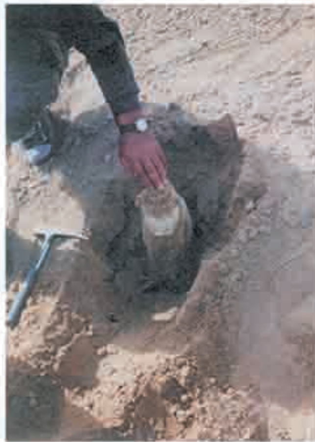
نگاره ۱: گیاهی با ریشه کوزه‌ای در نواحی بیابانی سیزوار (عکس از نویسنده ۱۳۸۰)

اکوسیستم‌های بیابانی و قابلیت‌های آنها در گرو میزان سازگاری اجزاء زنده آن با محیط است. بطوری که گیاهان در این اکوسیستم‌ها هیچگونه رقابتی با هم ندارند. زیرا بعلاوه شرایط بیابانی فاصله آنها آنقدر از هم دور است که تلاش برای ریش آن‌ها خطری برای دیگری نمی‌باشد. آن‌ها ریشه‌های خود را با بصورت عمودی در زمین فرو می‌کنند مثل شاخه‌ها و با بصورت افقی بخش می‌کنند مثل سبدها- تاغ‌ها برگ‌های کوچکی دارند یا کوتیکول‌هایی که جلوی تعرق شدیدشان را می‌گیرد. برخی از گیاهان که در سرزمین‌هایی با رطوبت بیشتر زندگی می‌کنند (بیابان‌های آریزونا و مکزیک) آب را در فصل مرطوب در اندام‌های بیرونی خود ذخیره می‌کنند (کاکتوس‌ها) برخی دیگر از گیاهان ریشه‌های کوزه‌ای (نگاره ۱) دارند که باعث درون آن لایف مانند بوده و رطوبت را از خاک گرفته و در ریشه کوزه‌ای خود ذخیره می‌کنند و در فصل خشک و با سال و سال‌های بعد آن را به مصرف می‌رسانند.