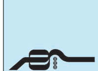
جدول ۲: امکانات بالقوه رودبار قصران