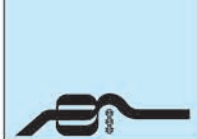
جدول ۱: تقسیم‌بندی‌های حوادث مؤثر بر شبکه جاده‌ای براساس نظر سنجی پیارک