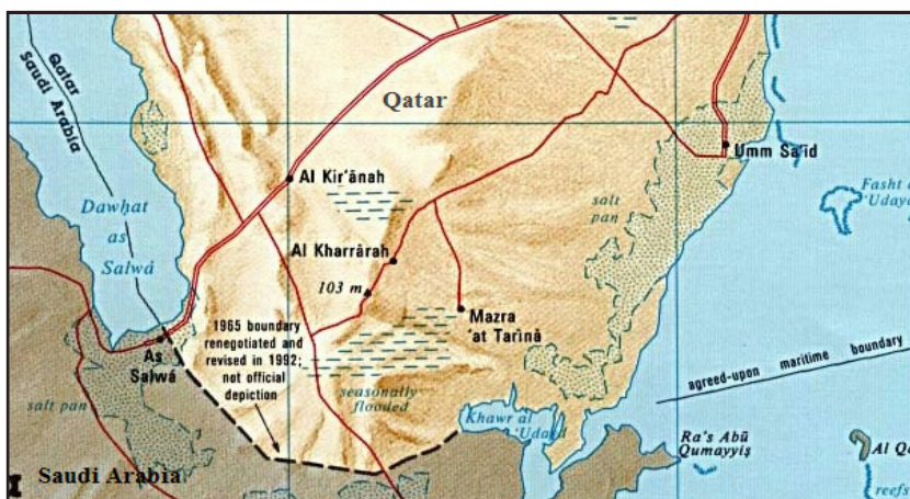
نقشه ۲: موافقت‌نامه دسامبر ۱۹۹۲؛ تعیین مرز دریایی در خلیج سلوا (غرب قطر) و ۲۰۰۸ در خورالعدید (شرق قطر)

به موجب این پیشروی‌ها سعودی‌ها خورالعدید را تصرف کرده و موفق شدند در شرق قطر به ساحل خلیج فارس دست یابند (منطقه ابوالخفوس). علاوه بر آن سعودی‌ها به دو هدف دیگر خود نیز دست یافته‌اند، یکی اینکه ارتباط زمینی قطر با امارات را قطع کرده و این کشور را در محاصره خود در آورده‌اند و دیگری شریک شدن در آب‌های ساحلی قطر در شرق این کشور است. منطقه ابوالخفوس از این جهت برای قطر مهم شمرده می‌شود که از این طریق می‌تواند به امارات، بزرگ‌ترین شریک تجاری خود مرتبط شود (خبرگزاری فارس، ۲۰۰۹/۲/۲). مرزهای دریایی عربستان با قطر در این منطقه و نیز در غرب قطر یعنی در خلیج سلوا که تا قبل از تهاجم عربستان به قطر در ۱۹۹۲ هنوز تعیین نشده بود، پس از تهاجم و تحت فشار عربستان تعیین گردید. قطر به موجب موافقت‌نامه مرزی منعقد در دسامبر ۱۹۹۲ ناگزیر گردید که بخشی از اراضی خود را در جنوب غربی یعنی در خلیج سلوا به عربستان واگذار نماید. در اجلاس دسامبر ۲۰۰۷ در دوحه نیز دو کشور قطر و عربستان سعی کردند تا اختلافات فی‌مابین را از میان بردارند. در جولای ۲۰۰۸ عربستان و قطر موافقت کردند تا مرزهای دریایی خود را مشخص کنند (نقشه ۲)