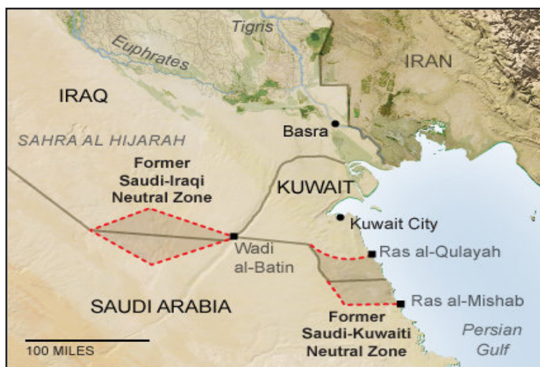
نقشه ۴: مناطق بی‌طرف میان عربستان با عراق و عربستان با کویت و تقسیم آنها در سال‌های ۱۹۸۱ و ۲۰۰۰

ایران و عراق نسبت به این توافقنامه معترض می‌باشند. آنچه باعث اعتراض ایران نسبت به این توافقنامه و تحدید مرز می‌باشد، این است که در ماده یک این توافقنامه پس از اشاره به مختصات این چهار نقطه آمده است: از نقطه ۴ خط تقسیم دریای مجاور منطقه تقسیم شده، در جهت شرق ادامه خواهد داشت. با توجه به اینکه این نقطه دارای مختصات ۲۸ درجه و ۵۶ دقیقه و ۶ ثانیه عرض جغرافیایی و ۴۹ درجه و ۲۶ دقیقه و ۴۲ ثانیه طول جغرافیایی است، در نتیجه نقطه مزبور از خط میانه خلیج فارس عبور کرده و عملاً توافق ایران و انگلیس (مسئول سیاست خارجی اعراب) در سال ۱۹۶۵ را نقض کرده است. این در حالی است که دو دولت عربستان و کویت در این توافقنامه حتی پیشروی از این نقطه به سمت شرق را نیز مدنظر قرار داده‌اند. همچنین با توجه به اینکه دو کشور کویت و عربستان توافق کرده‌اند که از منابع بستر و زیر بستر دو طرف مرز به طور مشترک استفاده کنند، در این صورت عملاً پای عربستان به منابع مشترک نفتی و گازی بین کویت و ایران مثل میدان آرش باز می‌شود. ایران نسبت به این تحدید حدود معترض است و اعتراض نامه‌ای را به سازمان ملل ارسال نموده و اعتراض خود را به اطلاع دو کشور کویت و عربستان رسانده است (میرحیدر و دیگران، ۱۳۸۶: ۱۴). در مورد تحولات مرزهای عربستان با عراق؛ در جریان بحران خلیج فارس دو واقعه عمده در رابطه با مرزهای بین