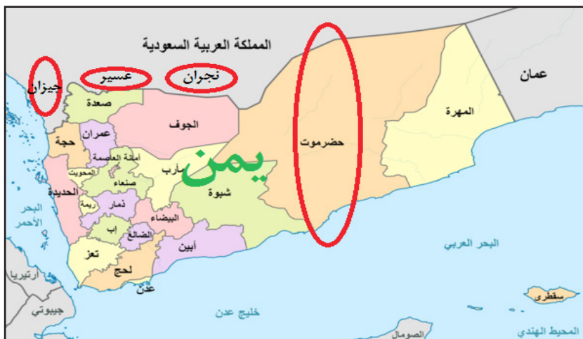
نقشه ۳: مناطق مورد ادعای کشورهای عربستان سعودی و یمن نسبت به یکدیگر

ادعاهای ابن سعود بر کویت باز می‌گردد، که بر اثر پافشاری بریتانیا مذاکرات بین ابن سعود و کویت که در آن زمان تحت‌الحمایه بریتانیا بود، منجر به انعقاد عهدنامه عقیر در سال ۱۹۲۲ گردید. به موجب آن مرزهای نجد و کویت تعیین و یک منطقه بیطرف بین آنها ایجاد گردید و طرفین در این منطقه از حاکمیت مشترک برخوردار بودند، به این مفهوم که می‌توانستند از منابع طبیعی آن به طور مساوی بهره‌برداری کنند. بعدها با کشف نفت به صورت تجاری در منطقه، طرفین یک موافقتنامه در ۷ ژوئیه ۱۹۶۵ در جده امضاء کردند. به موجب این موافقتنامه طرفین توافق کردند منطقه بی‌طرف از نظر جغرافیایی به دو قسمت مساوی میان دو کشور تقسیم شود. مورد بعد اختلافات دو کشور در مورد جزایر قارو و ام‌المرادیم است که در حاکمیت کویت قرار دارد (کمپ و هارکاو، ۱۳۱۳، ج ۱: ۱۶۱). حتی عربستان یک بار به صورت ناگهانی جزایر قارو و ام‌المرادیم را به اشغال خود درآورد. هر چند بعدها از این جزایر عقب‌نشینی نمود، اما از ادعای خود نسبت به جزایر صرف نظر نکرد. عربستان و کویت سرانجام در سال ۲۰۰۰ موافقتنامه‌ای را به امضاء رساندند که در آن ضمن به رسمیت شناختن حاکمیت کویت بر جزایر قاروه و ام‌المرادیم، با تعیین چهار نقطه مرز دریایی بین دو کشور را معین کردند. در ضمن عربستان و کویت بر سر بهره‌برداری مشترک از منابع بستر و زیر بستر دو طرف مرز با همدیگر به توافق رسیدند (نقشه ۴).