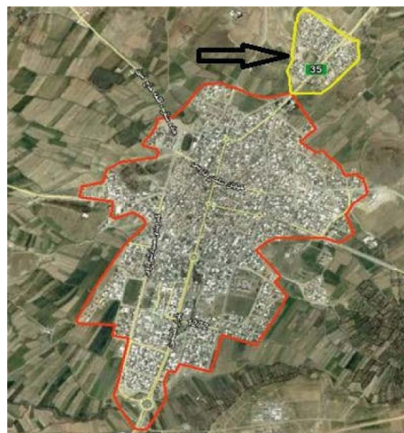
نگاره ۱: موقعیت شهرک حاشیه‌نشین شهدا نسبت به شهر

ماتریس ارزیابی عوامل درونی، حاصل بررسی عوامل درونی سیستم می‌باشد. این ماتریس، نقاط قوت و ضعف اصلی درونی سیستم را تدوین و ارزیابی می‌نماید. (زمانیان و همکاران، ۱۳۸۹، ۱۸۹) فرایند ارزیابی محیط درونی، موازی با فرایند بررسی عوامل بیرونی است. (Roberts and Sykes, 2000, 46) ماتریس ارزیابی عوامل بیرونی، حاصل بررسی عوامل بیرونی سیستم می‌باشد. این ماتریس، نقاط فرصت و تهدید اصلی بیرونی سیستم را تدوین و ارزیابی می‌نماید. عوامل درونی و بیرونی تأثیرگذار بر توانمندسازی شهرک شهدا طی ۴ گام مورد ارزیابی قرار می‌گیرد.