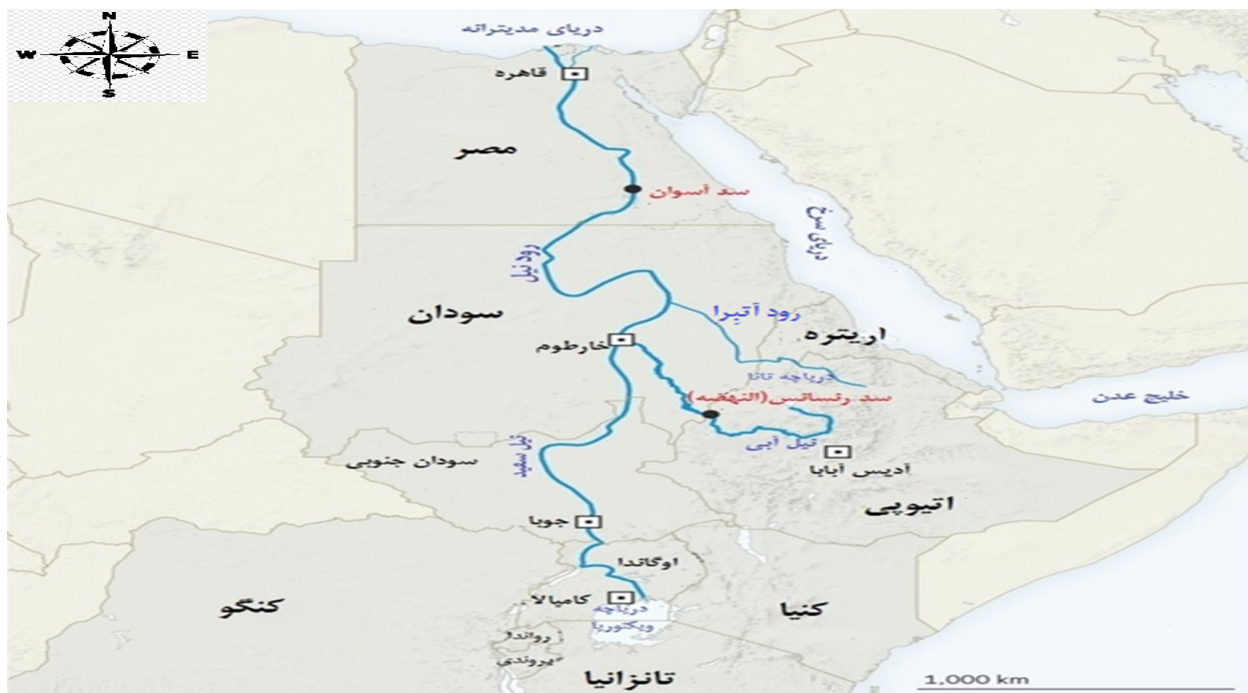
نگاره (۲): حوضه رودخانه نیل و شعب اصلی آن

برابر حفر آبراه «جونگله‌ای» - که ۱۵۰ کیلومتر از ۳۶۰ کیلومتر پیشتر به نام حدیثه نیز خوانده می‌شد، در منطقه گومز - بنیشانگول، حدود ۵۰۰ کیلومتری شمال غرب آدیس آبابا و ۳۲ کیلومتری شرق مرز سودان واقع شده است. ۱