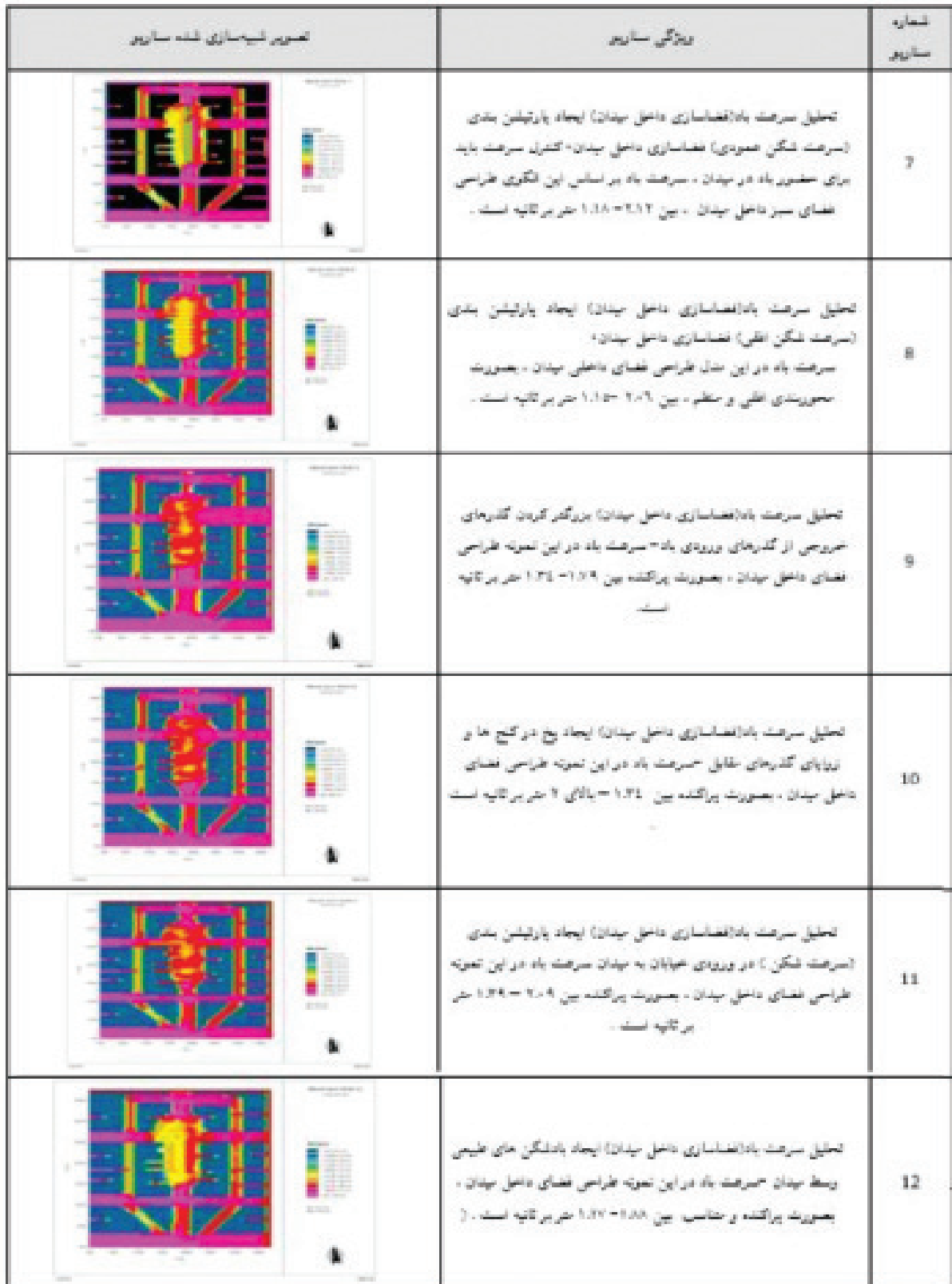
جدول ۵: سناریوهای شبیه‌سازی شده