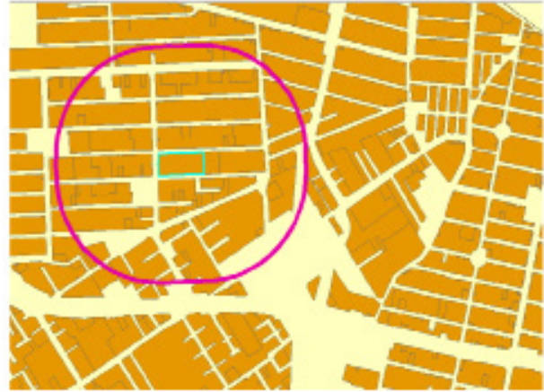
نگاره ۲: نمایشی از تحلیل‌های مکانی انجام شده

شده برای هر عارضه، یک سطر از ماتریس را پر می‌کند.