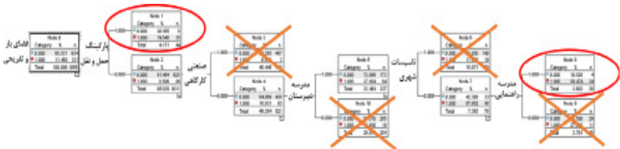
نگاره ۸: درخت حاصل برای کاربری فضای باز و تفریحی