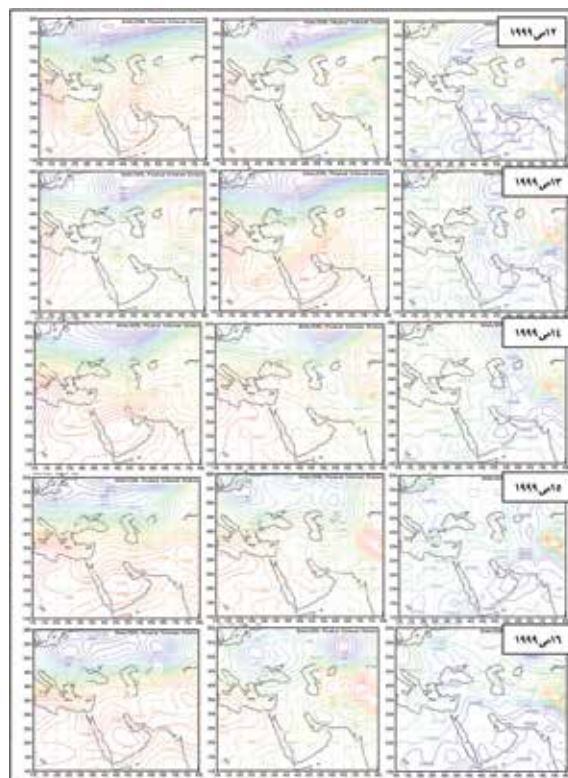
نگاره ۲- نقشه ترازهای فشاری ۷۰۰ و ۸۵۰ هکتوپاسکال (به ترتیب از راست به چپ) از ۴۸ ساعت قبل از شروع تا روز پایان - طوفان گرد و غباری ۱۴ تا ۱۶ می ۱۹۹۹

روی شرق مدیترانه و غرب عراق در حال شکل گیری می‌باشد. در تراز ۷۰۰ هکتوپاسکال ناوه کمی عقب‌تر از موقعیت آن در سطح ۸۵۰ هکتوپاسکال تا شمال سودان گسترش یافته است. میزان دید هنوز در وضعیت عادی قرار دارد. ۲۴ ساعت قبل از شروع (۱۳ می ۱۹۹۹) - در تراز دریا شرایط روز قبل شدت یافته و گرادیان حرارتی را در جنوب غرب و غرب ایران تشدید کرده است. در تراز ۸۵۰ هکتوپاسکال مرکز چرخندی بر روی شمال عراق بسته شده است. ضلع شرقی این ناوه منطقه مورد مطالعه را دربرگرفته و شرایط ناپایداری را بر روی منطقه مورد مطالعه ایجاد کرده است. برخلاف روز قبل در تراز ۷۰۰ هکتوپاسکال منطقه مورد مطالعه بدلیل قرارگیری در جلوی ناوه شرایط ناپایداری دارد و در نتیجه امکان بلند شدن ذرات گرد و غبار را فراهم می‌آورد. روز اول (۱۴ می ۱۹۹۹) - در تراز دریا پدیده غالب در این روز ادغام مرکز کم فشار روی عراق و کم فشار مهاجر اروپایی می‌باشد. مرکز کم فشاری نیز بر روی نیمه شرقی شبه جزیره عربستان به چشم می‌خورد. در تراز ۸۵۰ هکتوپاسکال در نتیجه حرکت سریع سامانه به سمت شرق منطقه مورد مطالعه در پشت ناوه قرار گرفته و جریانات حاکم در این تراز در منطقه مورد مطالعه شمال غربی است. این ناوه در تراز ۷۰۰ کمی عقب‌تر قرار دارد و پس از عبور از روی دریای خزر تا جنوب خوزستان امتداد دارد. جهت جریانات در این تراز بر روی عراق و منطقه مورد مطالعه غربی بوده و پربندها حالت مداری دارند.