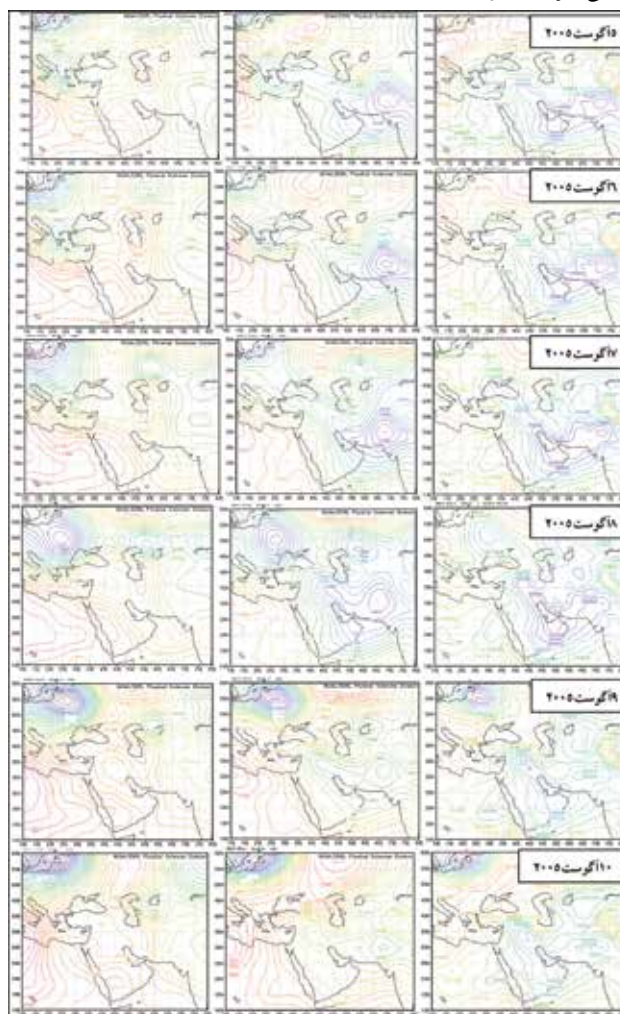
نگاره ۳- نقشه ترازهای فشاری ۷۰۰، ۸۵۰ و ۱۰۰۰ هکتوپاسکال (به ترتیب از راست به چپ) از ۴۸ ساعت قبل از شروع تا روز پایان - طوفان گرد و غباری ۷ تا ۱۰ آگوست ۲۰۰۵

پرفشاری که از شمال غرب وارد ایران شده است، قرار دارد. مقدار دید از اوایل روز شروع به کاهش کرده و در اواخر روز به زیر ۱۰۰۰ متر رسیده است. در تراز ۸۵۰ هکتوپاسکال، همچنان زیانه کم ارتفاع پاکستان منطقه مورد مطالعه و عراق را ناپایدار نموده است. در تراز ۷۰۰ هکتوپاسکال، شرایط کاملاً پایداری در نتیجه ادغام پراارتفاع جنوب دریای خزر و پشته ناشی از زیانه شرقی مرکز و اچرخندی آزور بر روی ایران، عراق و عربستان حاکم است و بدلیل عدم وجود شرایط همرفتی به لایه‌های بالاتر بر غلظت آلودگی افزوده خواهد شد.