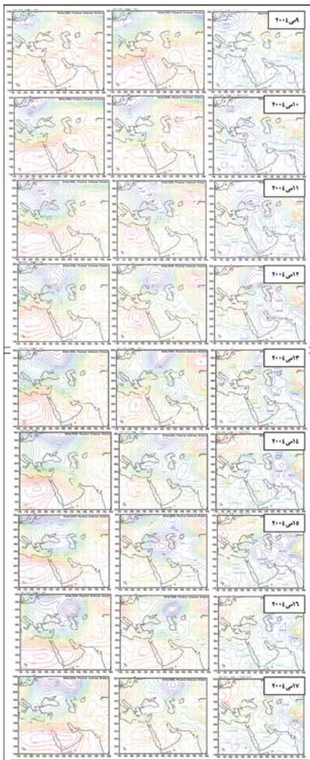
نگاره ۴- نقشه ترازهای فشاری ۸۵۰، ۷۰۰ و ۵۰۰ هکتوپاسکال (به ترتیب از راست به چپ) از ۴۸ ساعت قبل از شروع تا روز پایان- طوفان گرد و غباری ۱۷ تا ۱۱ می ۲۰۰۴

روز اول (۱۱ می ۲۰۰۴)- در این روز در تراز دریا زبانه کم فشاری غرب عراق را دربرگرفته و در تقابل با مرکز واچرخندی بسته شده بر روی زاگرس گرادیان حرارتی شدیدی را بر روی منطقه مورد مطالعه و غرب عراق بوجود آورده است. در تراز ۸۵۰ هکتوپاسکال همچنان بر روی منطقه مورد مطالعه، پشته حاکم است در حالی که ناوهای از شمال دریای سیاه، شرق ترکیه، شرق سوریه و مرکز عراق را دربرمی گیرد. در تراز ۷۰۰ هکتوپاسکال نیز شرایطی شبیه تراز ۸۵۰ هکتوپاسکال، حاکم است.