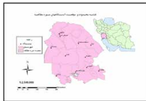
نگاره ۱: نقشه موقعیت و محدوده مورد مطالعه