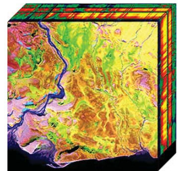
نگاره (۱): مکعب اطلاعات یا تصویر فراطیفی ( http://rst.gsfc.nasa.gov )

سنجنده‌های فراطیفی نیز کاری مشابه طیف‌سنجی در آزمایشگاه را انجام می‌دهند با این تفاوت که آن‌ها عکس‌العمل بازتابی قسمتی از سطح زمین را با توجه به فاصله نمونه‌برداری زمین ۳ در طول موج‌های مشخص اندازه‌گیری و در پیکسل‌های تصویر فراطیفی ذخیره می‌کنند. تصویر حاصل، یک ماتریس سه‌بعدی است، که آنرا مکعب اطلاعات ۴ یا تصویر فراطیفی می‌گویند. در نگاره (۱) یک تصویر فراطیفی نشان داده شده است.