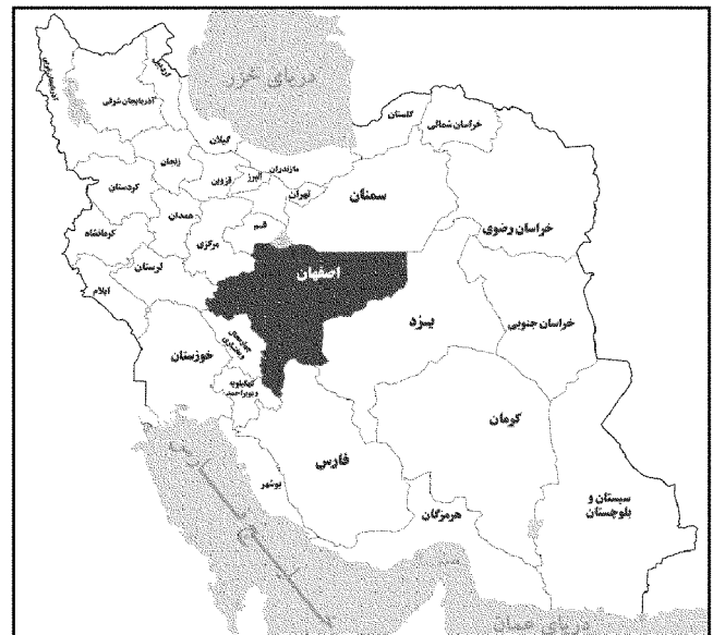
نقشه ۱: تقسیمات کشوری جمهوری اسلامی ایران به تفکیک استان

نتایج سرشماری عمومی نفوس و مسکن شهرستان اردستان، سال‌های (۱۳۳۵، ۴۵، ۵۵، ۶۵، ۷۵)