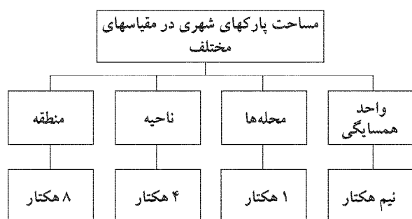
نمودار شماره ۱: مساحت پارکهای شهری در مقیاس‌های مختلف

این دسته بندی در نمودارهای شماره ۱ و ۲ نشان داده شده است.