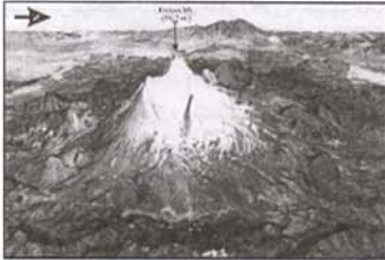
نگاره (۲): نمای پرسپکتیو از کوهستان ارجیس و دهانه آتشفشان آن

فعالیت حدود ۱۵۰۰۰ سال پیش پایان یافته است. در مرحله پایانی ذرات و قطعات جدا شده بسیار عظیم در اثر انباشته شدن روی هم، باعث بوجود آمدن نوک قله آتشفشان شده است. کالذرای آمفی تئاتور تقریباً دارای یک کیلومتر شعاع و دو کیلومتر عمق می باشد. نگاره (۲) چگونگی حفظ شیب دره جنوب شرقی مخروط آتشفشان را نشان می دهد.