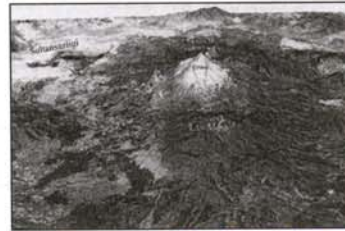
نگاره (۳): نمای پرسپکتیو از کمپلکس استراتوولکانوارجیس

تصویر ماهواره‌ای از ارجیس به وسیله خطوط منحنی دیجیتالی شده، تخمین زده می‌شود که مقیاس نقشه‌های توپوگرافیک آن حدود ۱/۲۵۰۰۰ می‌باشد. میزان خطای آن (۳/۰ میلی‌متر) در نقشه نشانگر میزان خطای ده متری در تصویر ماهواره‌ای است، که حدود خط عمود آن ۱۰ متر و مساحت آن ۳۸۰۰ کیلومتر مربع است. داده‌های ماهواره‌ای به سیستم مختصات زمین انتقال می‌یابد (از طریق سیستم تصویر تونورس مرکاتور). براساس تحقیقات ولش و بوزری (User, Welch) حداکثر خطا باید کمتر از اندازه پیکسل (Pixel) در ارسال ماهواره باشد. یعنی برای تصویر ماهواره‌ای حداکثر خطا باید بین ۰/۵ یا ۰/۵- باشد و بدین منظور ۴۰ نوع تصویر ماهواره‌ای جهت بررسی انتخاب شده است. ضمناً نرم‌افزار پردازش تصویر (ERDAS) به منظور بهره برداری صحیح از این دسته اطلاعات بکار گرفته می‌شود. نگاره ۳ یک برش سه بعدی از یک تصویر ماهواره‌ای یک کوه آتشفشان را نشان می‌دهد.