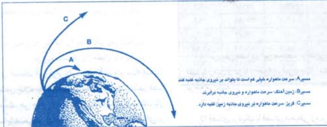
مسیر A: سرعت ماهواره بطور کم است تا بتواند بر نیروی جاذبه غلبه کند مسیر B: زمین آهنگ - سرعت ماهواره و نیروی جاذبه برابرند مسیر C: فریز - سرعت ماهواره بر نیروی جاذبه زمین غلبه دارد