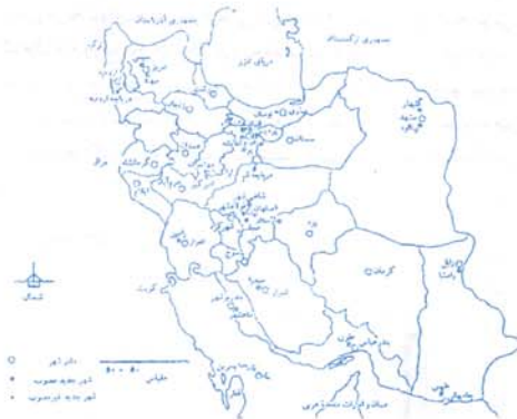
نقشه (۲): موقعیت شهرهای جدید در منطقه اصفهان

مجلسی و بهارستان برای جذب سرریزهای جمعیتی شهر اصفهان و ایجاد تعادل فضایی و اسکان شاغلان مراکز صنعتی منطقه طراحی و احداث گردیدند. (نقشه (۲)) شهر شاهین شهر در ۲۴ کیلومتری شمال اصفهان و در حاشیه شرق جاده تهران - اصفهان قرار دارد. هدف از احداث شهر، اسکان کارکنان بخش صنعتی حداثی اصفهان - شاهین شهر و جذب سرریز جمعیت شهر اصفهان بوده است. شهر جدید پولادشهر، یکی دیگر از شهرهای جدید منطقه است که در ۲۵ کیلومتری جنوب غربی اصفهان و ۱۰ کیلومتری کارخانه ذوب آهن و در کنار محور ارتباطی اصفهان - شهرکرد واقع گردیده است. هدف از احداث شهر اسکان کارکنان ذوب آهن و صنایع جانبی آن بوده است. شهر مجلسی نیز یکی از شهرهای جدید منطقه است که در ۷ کیلومتری جنوب غربی اصفهان و در مسیر جاده اصفهان - بروجن - خوزستان و در فاصله ۶ کیلومتری مجتمع فولاد واقع گردیده است. هدف از احداث شهر، فراهم آوردن زمینه اسکان برای اهالی منطقه و شاغلان مجتمع فولاد می‌باشد. شهر جدید بهارستان نیز یکی از شهرهای جدید منطقه به شمار می‌آید که در ادامه به بررسی دقیق تر آن خواهیم پرداخت.