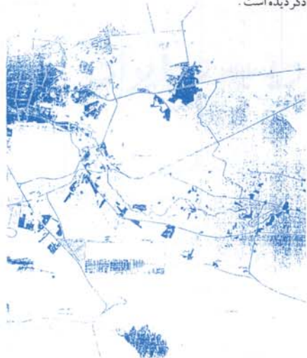
نقشه شرکت عمران شهر جدید بهارستان، آگهی طرح جامع شهر جدید بهارستان، کاتالوگ شهر جدید بهارستان، ۱۳۶۷.

شهر جدید در بعد از انقلاب، به منظور هدایت آگاهانه توزیع جمعیت منطقه و همچنین جلوگیری از تخریب اراضی کشاورزی حاشیه زاینده رود ایجاد گردیده است.