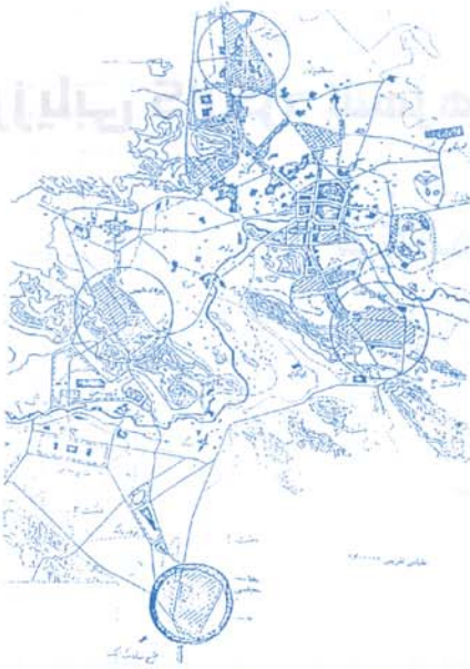
ماترک شرکت عمران شهر جدید پارسه، گروه‌های همسایه، شهر جدید پارسه

در برنامه شرکت عمران بوده که قرار است در اطراف مادر شهرها مکان‌یابی گردند که توزیع فضای آن در نقشه (۱) آمده است.