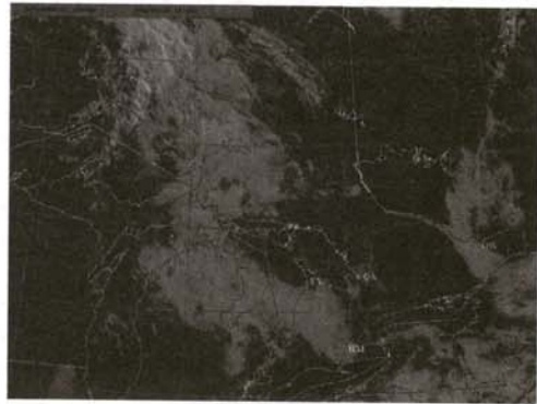
نگاره (۵): GOES، ۱۰ آگوست ۲۰۰۰، ساعت ۱۱/۴۵ به وقت محلی شباهت دو تصویری که در بالا شرح داده شد و پیوستگی این تصاویر با دیده بانی‌های انجام شده در فرودگاه، نشان می‌دهد که، روش تفاوت

رندها (۱۷) در این ساعت تصویری با باندتهای متفاوت از آنچه که مدنظر است ارسال می‌دارند که استفاده‌ای ندارد، زیرا با تشعشعات آفتاب که در مباحث بالا شرح داده شده، آمیخته می‌شوند. نگاره (۵) تصویری بصری از ماهواره GOES که در ساعت ۱۱/۴۵ به وقت محلی گرفته شده است را نشان می‌دهد. این نزدیکترین زمان برای گرفتن تصویر بصری قابل استفاده‌ای بود که می‌توانست با در نظر گرفتن زاویه ارتفاع خورشید در ساعت‌های اولیه صبح گرفته شد. شباهت آن با تصویر مهی که در ساعت ۹/۴۴ به وقت محلی گرفته شده است قابل توجه می‌باشد. ساختار و موقعیت متوسط مقیاس سه باندی که بیشتر تشریح شد بسیار شبیه هستند. با وجود این تغییر مکان جزئی در موقعیت وجود داشت که عبارت بودند از: مجموعه‌ای که در ساعت ۹/۴۴ به وقت محلی در شمال هامیلتون قرار داشت به طرف جنوب جابه‌جا شد و در ساعت ۱۱/۱۵ به وقت محلی بر روی هامیلتون قرار گرفت. این امر با مشاهداتی که در موقعیت‌های هوایی گرفته شده است مطابقت دارد. همچنین مشخص شد که مجموعه نزدیک اتاوا به طرف جنوب جابه‌جا شد.