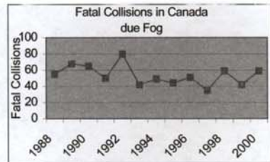
نگاره (۱): تصادفات مهلک در کانادایه علت وجود شرایط مه

از سال ۱۹۸۸ تاکنون، تصادفات مهلک در شرایط مه غلیظ، مه دود و مه تنک، دامنه‌ی تغییراتی کمتر از ۳۵ تصادف در سال ۱۹۹۷ تا ۸۰ تصادف در سال ۱۹۹۲ را نشان می دهد. در سالهای مورد مطالعه، تعداد تصادفات مهلکی که در شرایط مه غلیظ، مه دود و مه تنک رخ داده اند، از سال ۱۹۹۳ به بعد افزایش را نشان می دهند. (نگاره ۱). ضمناً تعداد کل تصادفات مهلک از سال ۱۹۹۰ به بعد، بیانگر این واقعیت است که تصادفات به طور پیوسته و بکثرت در این سالها کاهش یافته اند. (Transport Canada, 2001)