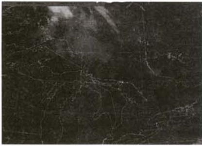
نگاره (۳): تصویر ماهواره‌ای GOES که در تاریخ ۱۰ اگوست ۲۰۰۰ در ساعت ۹/۴۴ به وقت محلی کانادا گرفته شده است.

توده‌های ابری استراتوس است. هانت (۱۱) (۱۹۷۳) پیش‌تر از این مبانی نظری را گسترش داد و والرود (۱۲) (۱۹۹۵) اطلاعات GOES را مورد استفاده قرار داد. ورود دریافت که تکنیک تفاوت باند یک آشکارساز قابل اجرا و مؤثر برای تشخیص مه و استراتوس در طول شب در سرتاسر یک محدوده گسترده از زمین و رژیم‌های حرارتی است. اما به محض طلوع آفتاب، روش هانت -الرو به دلیل ترکیب شدن باند ۳/۹ میکرومتر با نور منعکس شده خورشید کارایی خود را از دست می‌دهد. در ۱۱ اگوست سال ۲۰۰۰ در شمال انتاریو، اغتشاشات فوقانی اتمسفر، مقداری ابر با ارتفاع متوسط و رگبار و طوفانهای شدید را با خود به همراه آورد. جنبه شرق انتاریو تحت نفوذ یک زبانه ضعیف پر فشار قرار داشت.