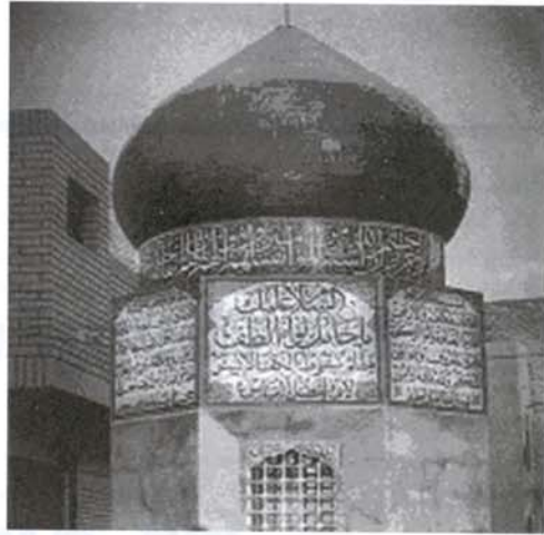
نگاره (۱۲): محل قطع شدن دست چپ حضرت ابوالفضل (ع)