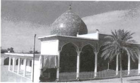
نگاره (۱۴): حرم حرین یزیدریاحی (ره)