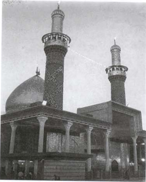
نگاره (۱۰): آستان مقدس حضرت ابوالفضل (ع)

گرداگرد قبر مطهر را چهار رواق و صحن فراخ و وسیعی به همراه ایوان زیبا دربر گرفته است. ضریح زیبای آن حضرت به دستور مرحوم آیت العظمی حکیم در سال ۱۹۶۵ میلادی در اصفهان ساخته شد. (نگاره (۱۱))