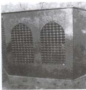
نگاره‌های (۷۶) و (۷۷): مقتل امام حسین (ع) قبل و بعد از ضریح گذاری (گودال قتلگاه)