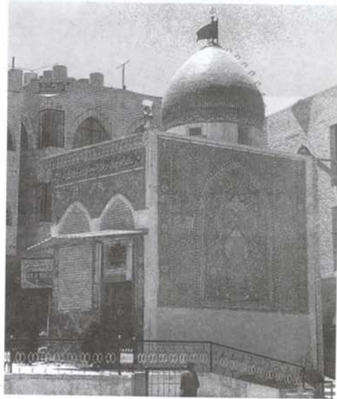
نگاره (۸): تل زینبیه

در فاصله ۲۰ متری از سمت غرب صحن مطهر، تپه‌ای به ارتفاع ۵ متر وجود دارد که امروزه بر روی آن اتاقی ساخته شده است (نگاره (۸)). این تپه به نام تل زینبیه یا تپه حضرت زینب (ع) مشهور است و بنا به نقل مورخان تپه‌ای بوده است که در روز عاشورا حضرت زینب بر روی آن می‌رفته و از سیر و قایع جنگ آگاهی می‌یافته‌اند.