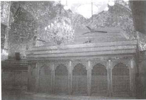
نگاره (۵): ضریح شش گوشه امام حسین (ع)