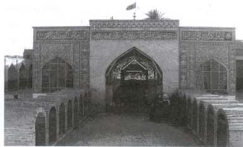
نگاره (۱۳): محل خیمه گاه کاروان امام حسین (ع)

در جنوب صحن مطهر امام حسین (ع) و در فاصله ۲۵۰ متری واقع است (بنا به نقل مورخان، محل پیرافراشته شدن خیمه‌ها و چادرهای سیدالشهدا و یاران او بوده است). امروزه جایگاه خیمه‌ها را با ساختمان سازی به نمایش گذاشته‌اند. (نگاره (۱۳)).