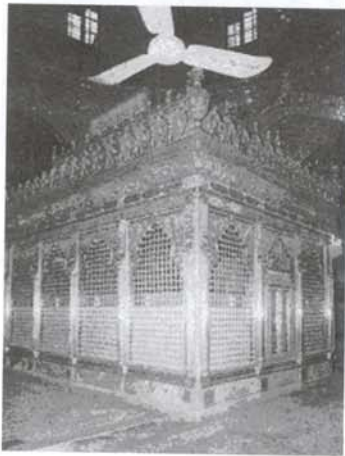
نگاره (۱۱): ضریح حضرت ابوالفضل (ع)