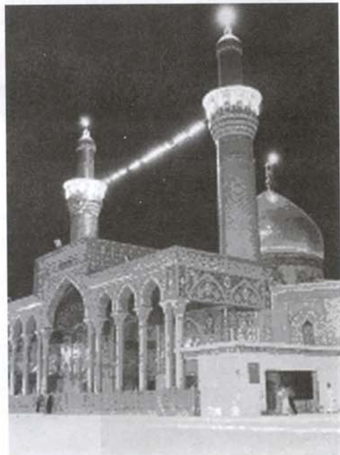
نگاره (۴): حرم مطهر امام حسین (ع) در شب