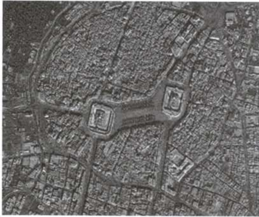
نگاره (۱): تصویر آیکونوس شهر کربلا