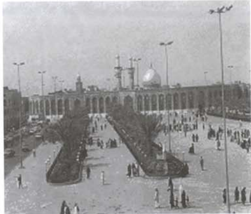
نگاره (۳): نمای بیرونی حرم مطهر امام حسین (ع) -

کاشی معرق و نغیس اصفهان تزیین یافته است. سقف بلند ایوان را مجموعه‌ای از ستونهای مرمرین، تراش هنرمندان اصفهانی نگاه داشته است