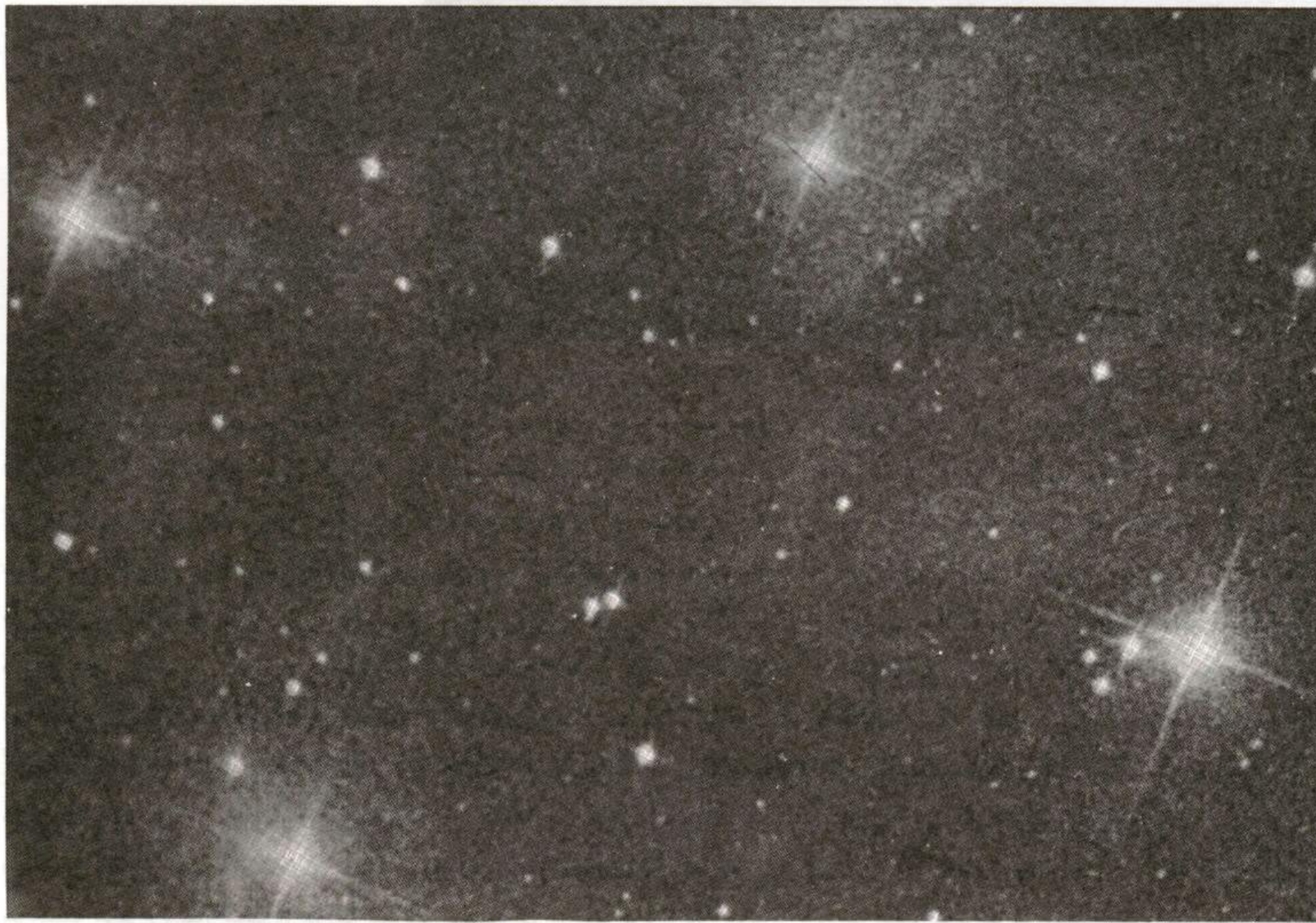
ستاره خوشه پروین نشاندنده گروهی از ستاره‌ها است که ۵۰ میلیون سال قبل تشکیل شده است.

پاورقی: (۱) دیاگرام HR عبارت است از تغییراتی که در دمای سطحی و درخشش ستاره رخ می‌دهد. (۲) Torus